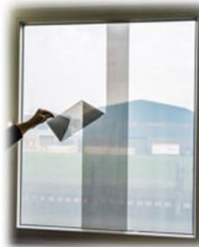
Obere Bahn abziehen