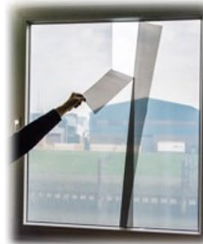
Untere Bahn abziehen