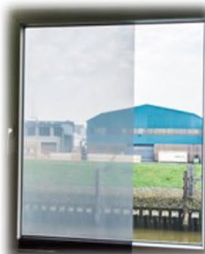
anhaften der 1. Bahn