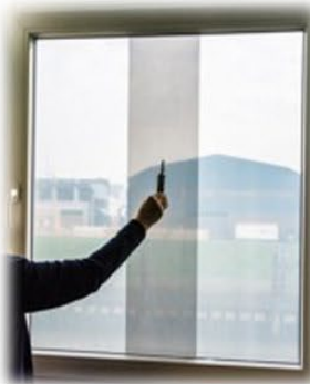
Schnitt in die Überlappung setzen