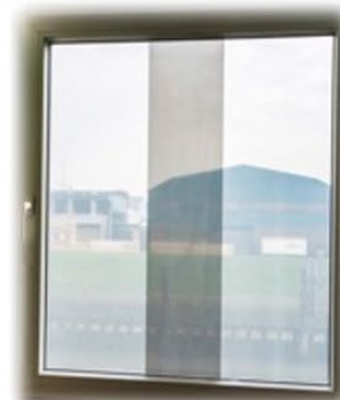
anhaften der 2. Bahn